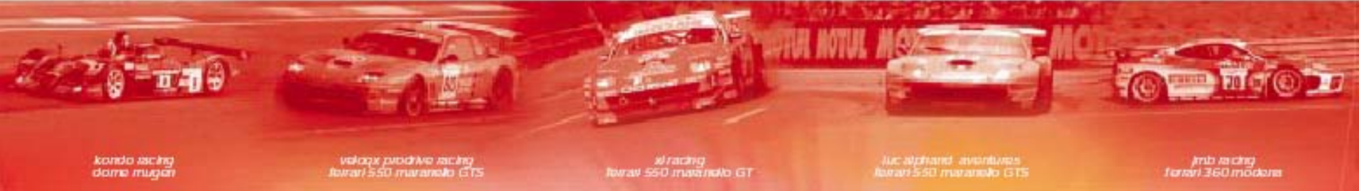
kondo racing dome mugen