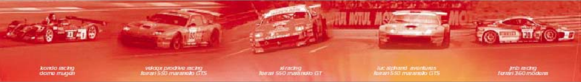
kondo racing dome mugen