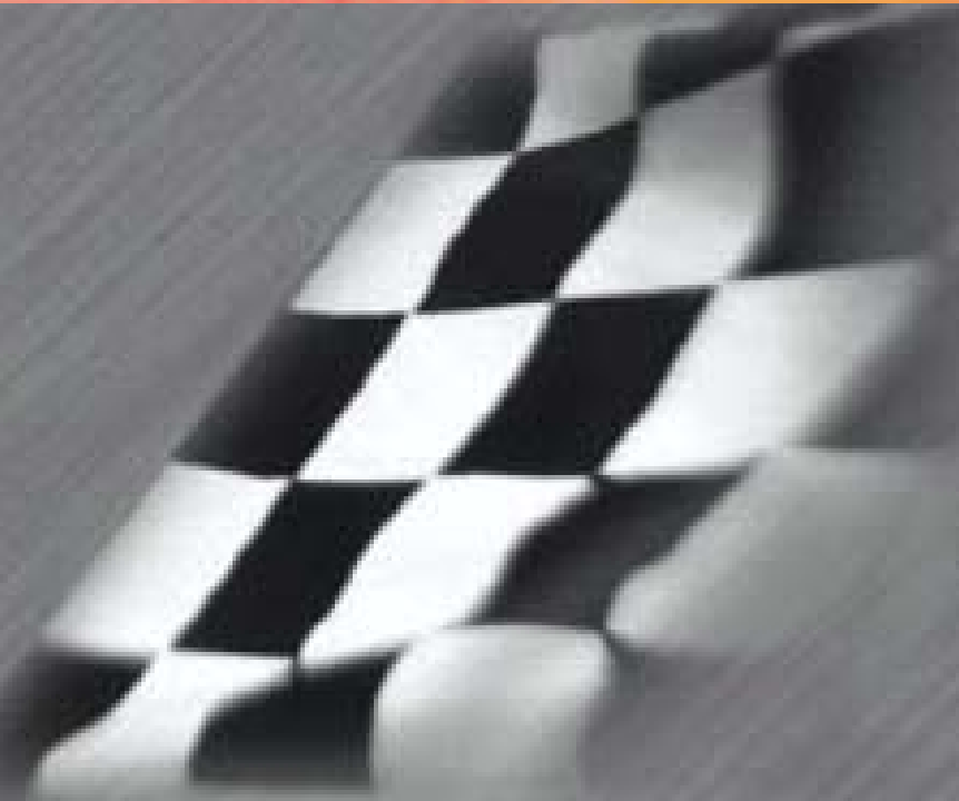
jmb racing Ferrari 360 modena