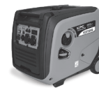
K3750IG - K4500IG