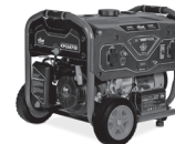
KPC6875E - KPC8750E