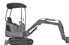
XRE 10 PRO