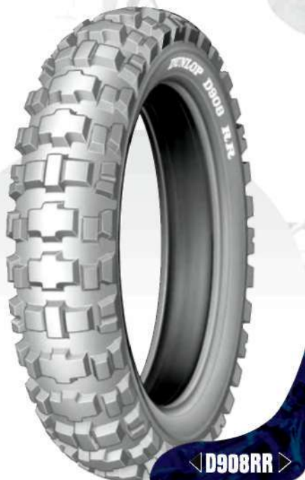
◁ D908RR ▷