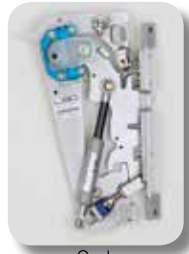
Opel Astra GTC