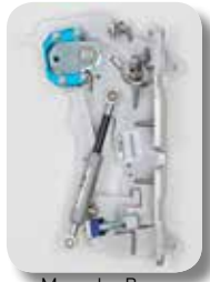
Mercedes-Benz SL Typ 230

Every LSD application has been newly developed for every single car. All important car measurements have been considered and therefore no application is similar to one another.