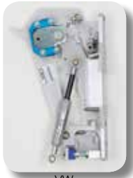
VW Golf V