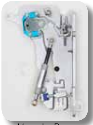
Mercedes-Benz SLK Typ 171